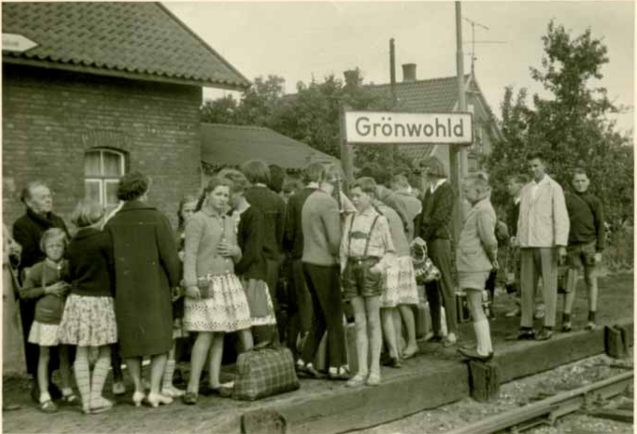
Um 1962 gehen die älteren Schüler auf Klassenfahrt und werden auf dem Grönwohlder Bahnhof verabschiedet