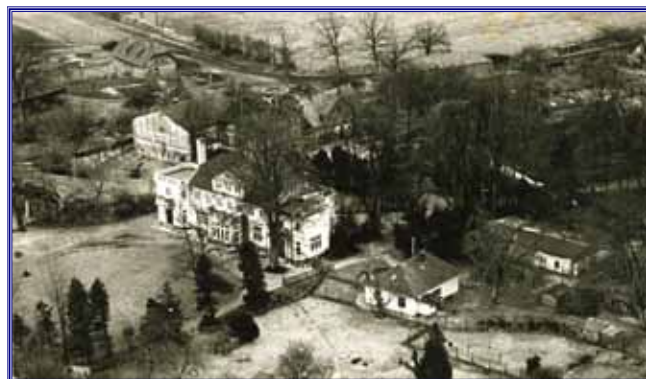
Blick auf das Herrenhaus des Grönwohldhofes um 1951